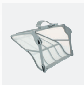
Filtro rectangular Filtro muy rígido de gran capacidad (5 litros)