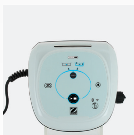
Unidad de control